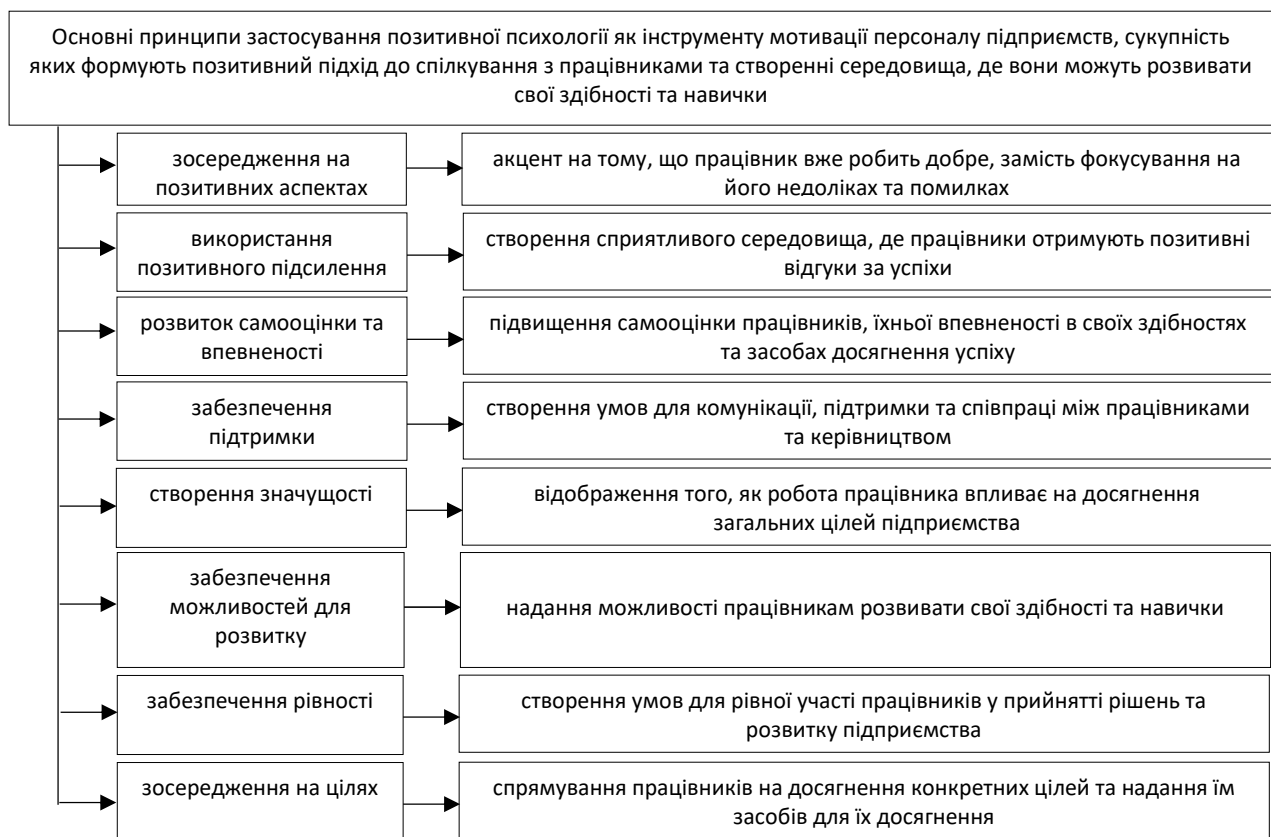
Рисунок 1 – Основні принципи застосування позитивної психології як інструменту мотивації персоналу

Проаналізуємо основні принципи застосування позитивної психології як інструменту мотивації персоналу підприємств та узагальнимо їх на рис. 1.